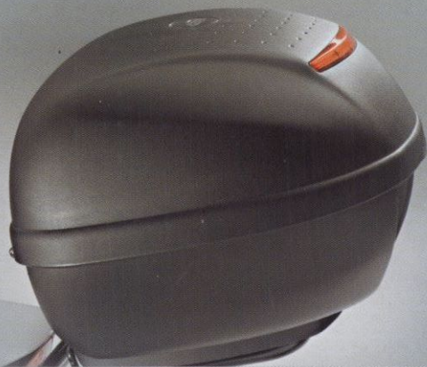
Gepäckträger mit Topcase