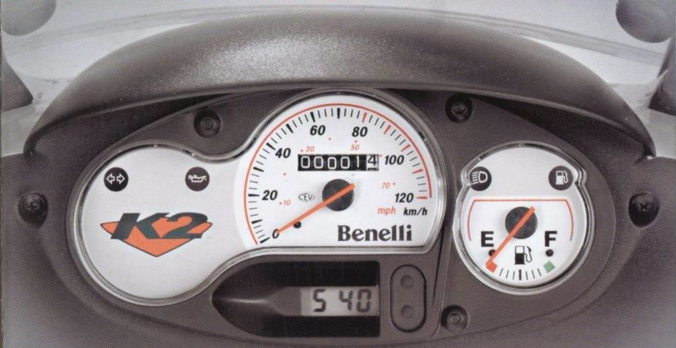
Sport-Cockpit mit Zeituhr