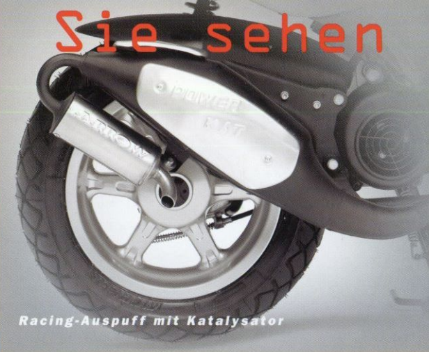
Racing-Auspuff mit Katalysator